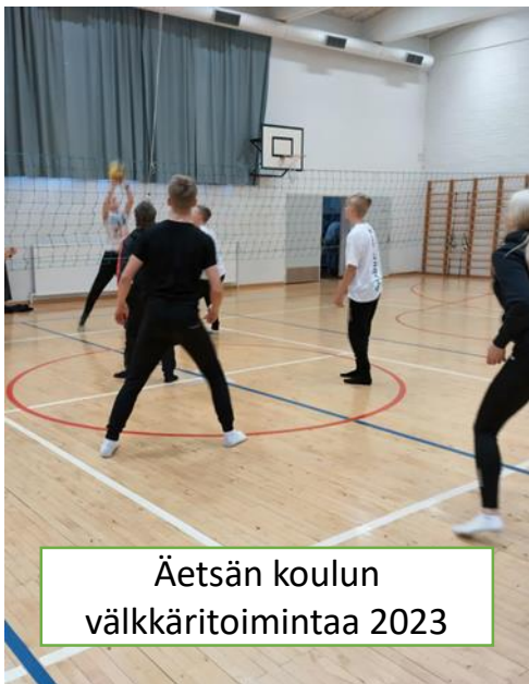
Äetsän koulun välkkäritoimintaa 2023