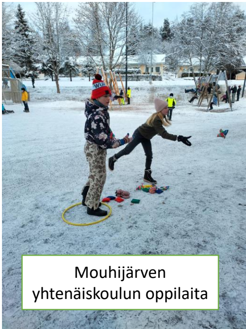
Mouhijärven yhtenäiskoulun oppilaita